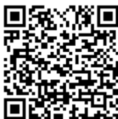
QR code สำหรับการลงทะเบียนล่วงหน้า

โดยบริษัทฯ จะเปิดให้ผู้ถือหุ้นหรือผู้รับมอบฉันทะลงทะเบียนล่วงหน้าผ่านทางเว็บเบราว์เซอร์ (Web Browser) ที่ https://register.pttdigital.com/PRINSIRI-EGM/registerbase หรือสแกน QR Code ได้ตั้งแต่วันที่ 16 ตุลาคม 2567 จนถึงวันที่ 22 ตุลาคม 2567 จนกว่าการประชุมจะแล้วเสร็จ