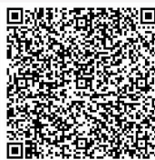
คู่มือการใช้งาน Pre-Register