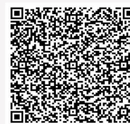
คู่มือการใช้งาน E Voting