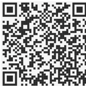
QR code สำหรับการลงทะเบียนล่วงหน้า

โดยบริษัทจะเปิดให้ผู้ถือหุ้นหรือผู้รับมอบฉันทะลงทะเบียนล่วงหน้าผ่านทางเว็บเบราว์เซอร์ (Web Browser) ที่ https://register.pttdigital.com/PRIN/registerbase หรือสแกน QR Code ได้ตั้งแต่วันที่ 17 เมษายน 2568 จนถึงวันที่ 25 เมษายน 2568 จนกว่าการประชุมจะแล้วเสร็จ